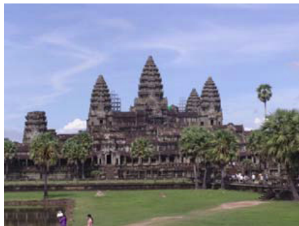
Chrám Angkor Vat v Kambodži

Monitoring deformací a teplot vybraných chrámů prokázal, že rozdíl maxima a minima teplot na intenzivně osluněných plochách vnějšího povrchu během ročního cyklu přesahuje 60 °C. Značné teplotní rozdíly jsou i mezi dnem a nocí, teplota na vnitřním povrchu byla často o cca