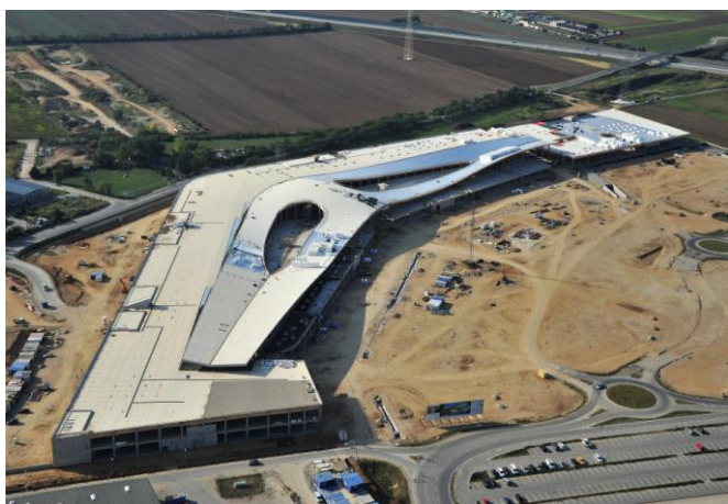
Letecký pohled na nákupní centrum v Gerasdorfu.

Dlubal Engineering Software www.dlubal.cz